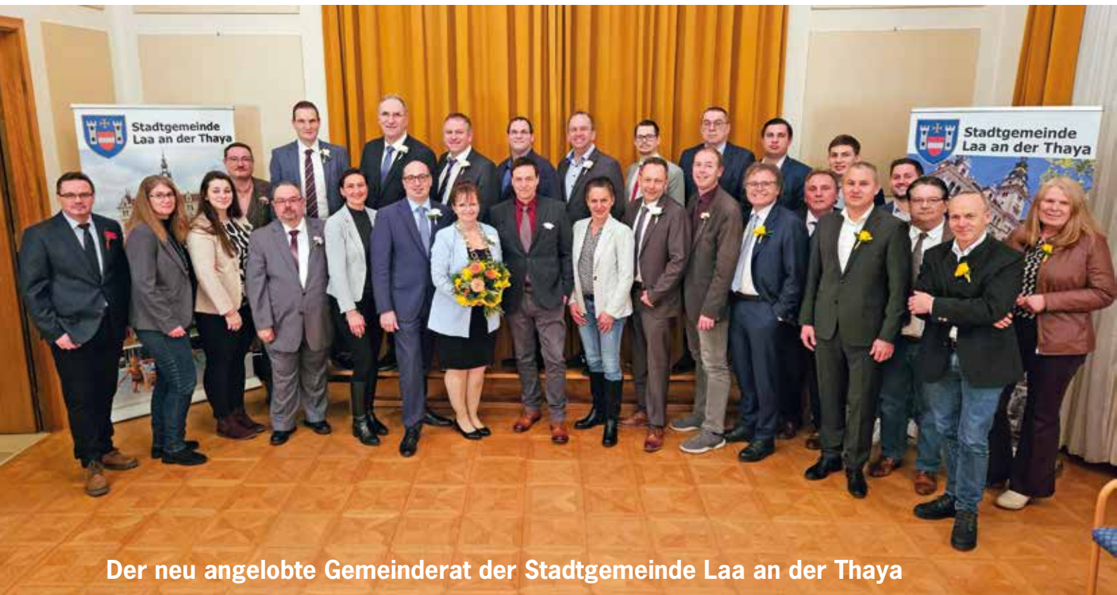
Der neu angelobte Gemeinderat der Stadtgemeinde Laa an der Thaya

Die Wahl der Vorsitzenden und Stellvertreter zu den einzelnen Ausschüssen inklusive Prüfungsausschuss erfolgt separat in den jeweiligen Gremien. ■